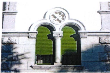
Detalj s lovranske Ville Denes

Ciklus predavanja završen je s Riccardom Marussijem i razmatranjima o sociološkoj i turističkoj vrijednosti povijesne arhitekture. Nakon predavanja sudionicima je omogućeno virtualno razgledavanje izložbe. Informacije vezane uz projekt mogu se pronaći na mrežnim stranicama https://www.attilio-maguolo.com/ .