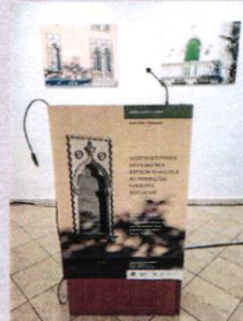
U Lovranu su rekonstruirali lik i djelo Attilia Maguola

Najveći je broj građevinskih objekata Attilio Maguola izgradio na lovranskom području, a zajedno s likom i lčićima gdje su također nicali objekti pod njegovim nadzorom, napravljeno je stotinjak građevina. Na njihovim pročeljima nalaze se najljepši secesijski elementi koji su prilagođeni mediteranskom duhu. Ovaj je jedinstveni arhitekt bi stručnjak za umetanje venecijanskih dekorativnih elemenata na fasade ljetnikovaca, te je za sva vremena zadužio Opatijsku rivijeru.