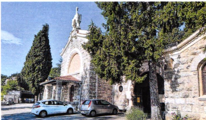
Ulaz prema groblju u Lovranu