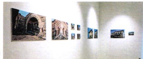
Lijepo građevine na slikovnim zapisima